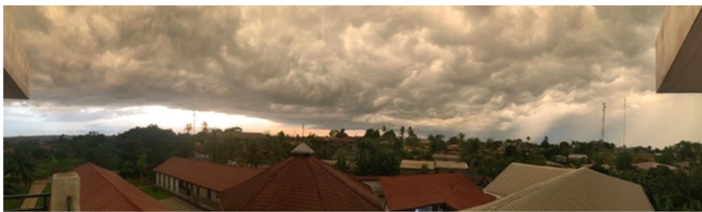
Figure 4 e 5 – In alto: un'altra vista del panorama al tramonto, durante un temporale tropicale. In basso il vescovo con i nuovi ammessi e nuovi accolti dopo la messa.