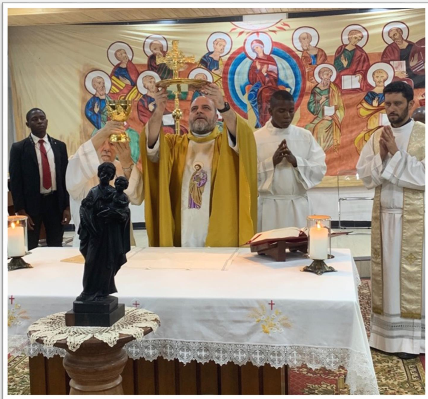
Figura 11 – Un momento della s. messa per la solennità di San Giuseppe in seminario.

Il 20 marzo abbiamo celebrato in seminario la solennità di san Giuseppe, il vero economo del seminario ed abbiamo festeggiato in suo onore, approfittando della "pausa nella quaresima".