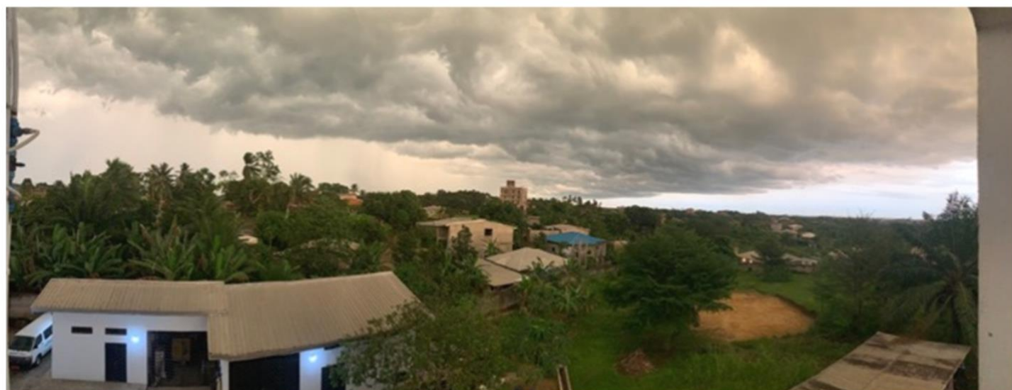
Figure 2 e 3- Sopra la classe "in terrazza" durante un temporale: davanti i due filosofi con don Marco e dietro due teologi che studiano. Sotto un paesaggio ripreso dalle nostre scale al tramonto durante un temporale tropicale.

Gli ultimi giorni di lezione sono sempre un po' particolari, per i compiti in classe e per le prove in itinere; inoltre abbiamo utilizzato la terrazza coperta come aula di classe all'aperto, visto che quando piove la temperatura si rinfresca molto, e per i frequenti blackout approfittiamo della ventilazione naturale.